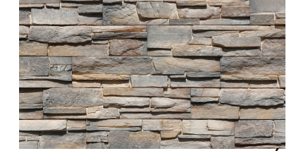
OKŁADZINA IMITUJĄCA KAMIEN