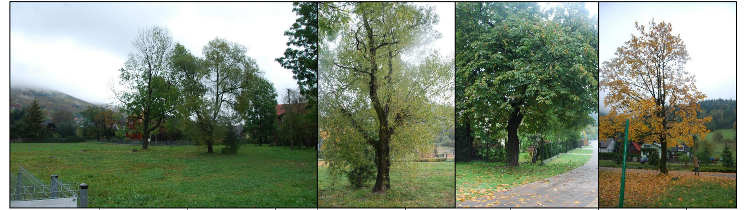
nr. 1 nr. 3 nr. 2 nr. 5 nr. 4